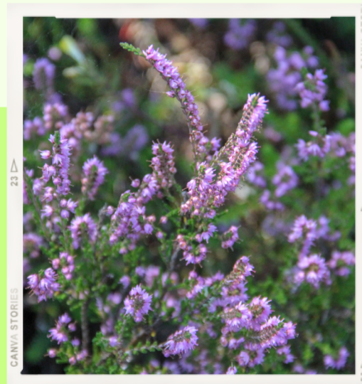
Dabas parks "Piejūra"