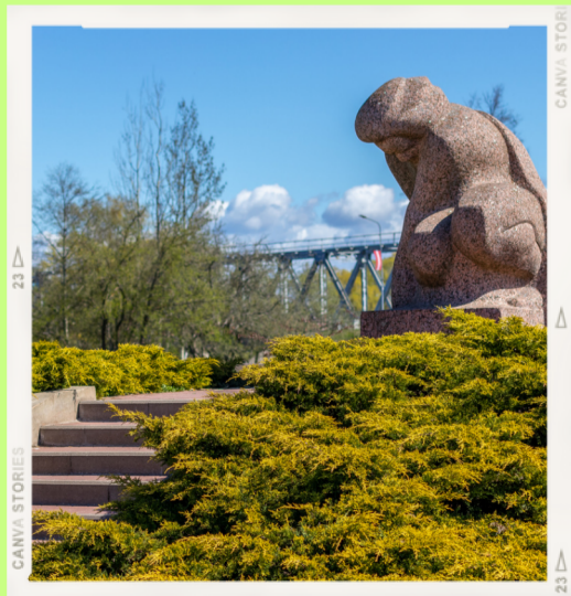
V.Titāna skulptūra "Atceroties"