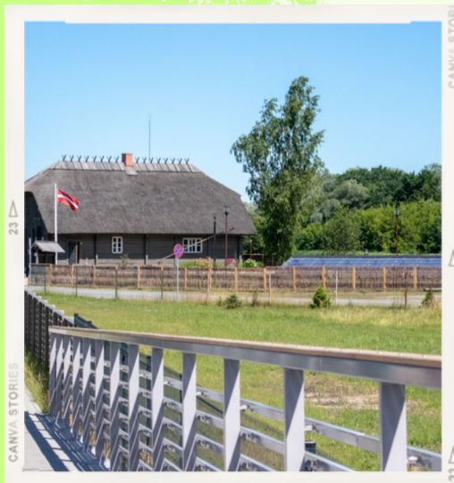
Carnikavas novadpētniecības centrs