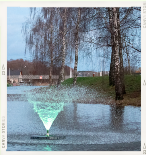
Strūklaka pie Laivu ielas