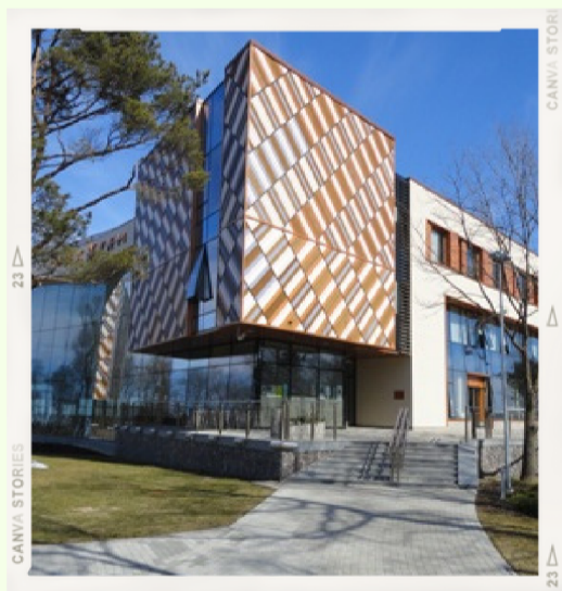
Ādažu kultūras centrs