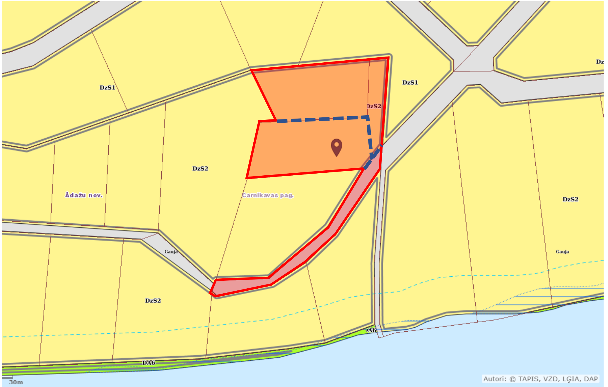
Attēls 2 – Zemesgabala TIAN