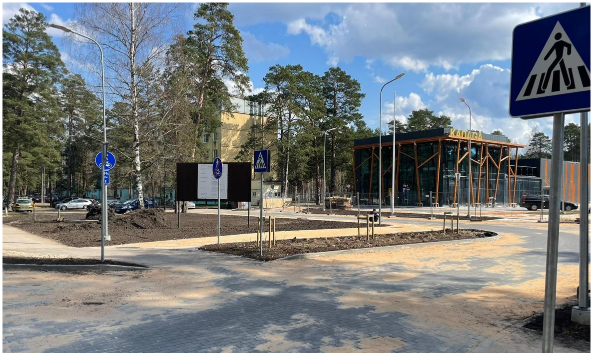
2. Attēls. Reklāmas baneris uz zemes vienības ar kadastra apzīmējumu 8044 005 0675, fotofiksācija, 2023. gads.