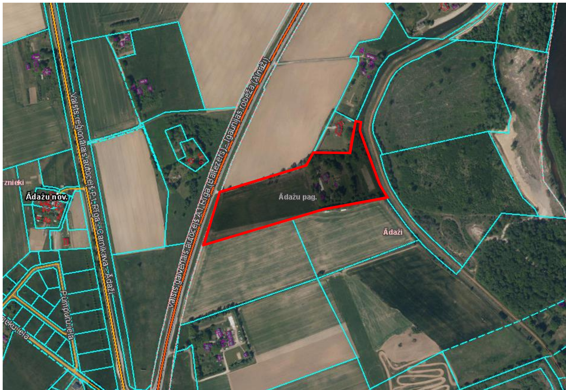
Attēls 1 – zemesgabala novietojums kadastrā