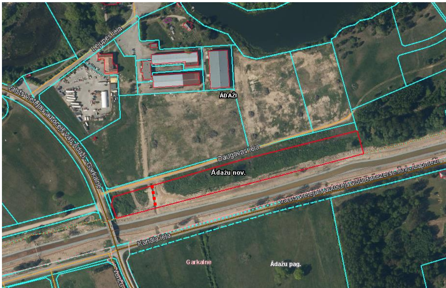
Attēls 1 - Zemsegabala novietojums kadastrā