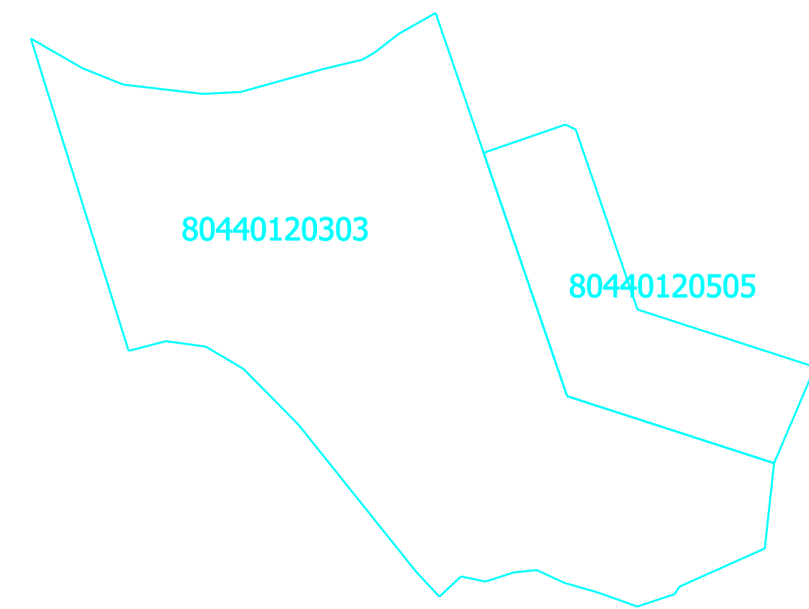
Projektētā teritorijas shēma pirms zemes ierīcības projekta izstrādes