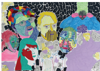
IEVA MADARA PIKURE