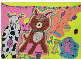
ped. Iltnere ŠARLOTE ŠULTE