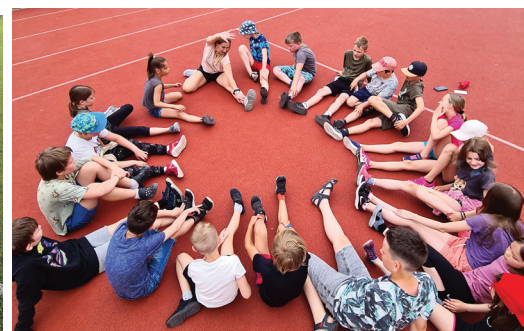
Fizisko aktivitāti veicinošana nometne bērniem.