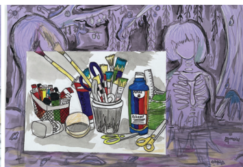
ped. A.Augstkalna ADRIJA BOKA