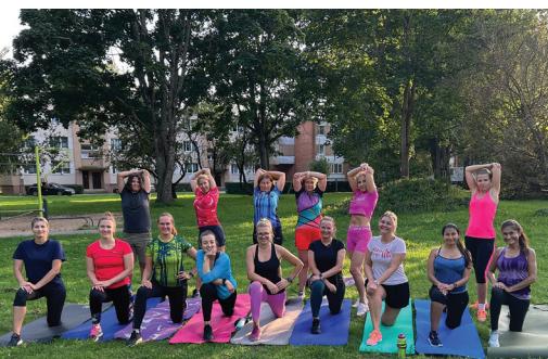
Āra vingrošanas nodarbības pieaugušajiem un nūjošanas nodarbības pieaugušajiem un bērniem Carnikavā.