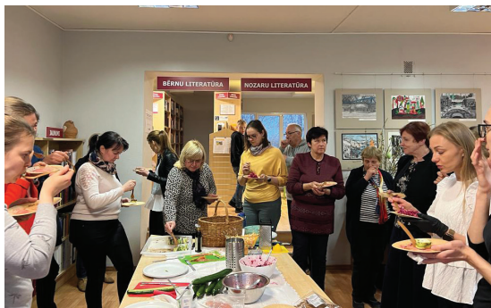
Tematiskais pasākums par veselīga uztura lietošanu Ādažu bibliotēkā.