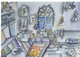
ped. S.Fārenhorste IEVA STUCKA