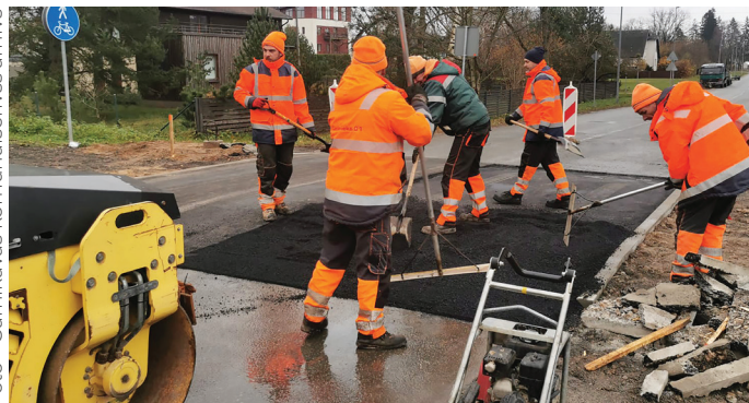
Izbūvēts ātrumvalnis Jūras ielā, Carnikavā.

Jūras ielā, Carnikavā gājēju pārejai izbūvēts ātrumvalnis. Darbi turpināsies nākamgad pēc tehnoloģiskā pārtraukuma. Uzstādītas un atjaunotas bojātās ceļa zīmes un ielu norādes, pie Ādažu vidusskolas uzstādīti jauni signālstabiņi.