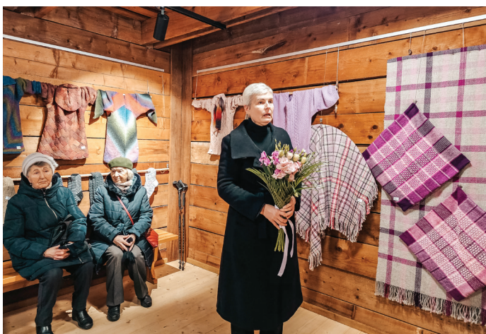
Carnikavas Novadpētniecības centrā atklāta pirmā TLMS "Auseklītis" rokdarbu izstāde.