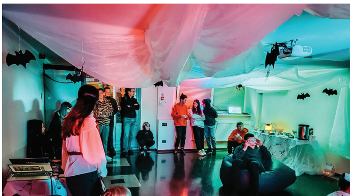
Carnikavā, Stacijas ielā 5 atklātas Jauniešu telpas.