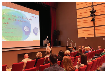
Tematiskais pasākums Ādažu Kultūras centrā garīgās veselības veicināšanai par izdegšanas profilaksi.