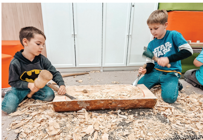
Carnikavas pamatskolēni piedalījās "Namdaru darbnīcā", iepazīstot kokamatniecību.