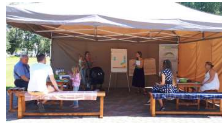
08.08.2020. Līgo laukumā