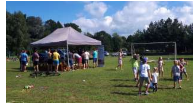
01.08.2020. Garkalnes sporta laukumā