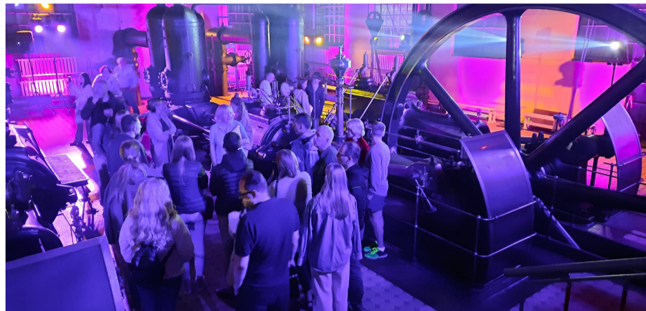
● Muzeju nakts ietvaros bija iespēja apmeklēt sūkņu staciju.