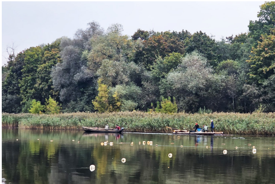
● Plosta ceļš pa Gauju līdz Carnikavas Novadpētniecības muzejam.

Vējdēļa būvēšanai padomju cilvēki izmantoja vietējās izejvielas, piemēram, priedes koka listes un saplākšņa plāksnes. Dēļa ūdensnecaurlaidība tika panākta, aplīmējot to ar stiklšķiedras audumu, ko bieži vien ieguva no aizkariem, ko pārdeva saimniecības preču veikalos. Buras šūšanai tika izmantots izpletņu audums, kuru varēja iegūt no armijas. Šis inovācijas ļāva cilvēkiem izgatavot dēli, kas atbilstu viņu vajadzībām. 1976. gadā notika pirmās vindsērfinģa