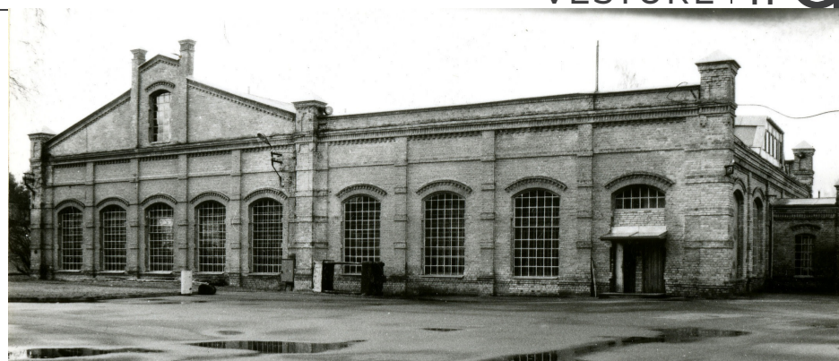
● 1904. gadā būvētā sūkņu stacijas ēka.