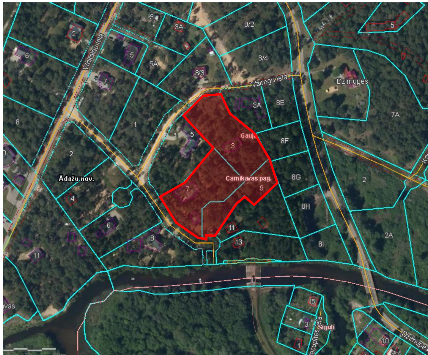
Attēls 1 - Zemesgabala novietojums kadastrā