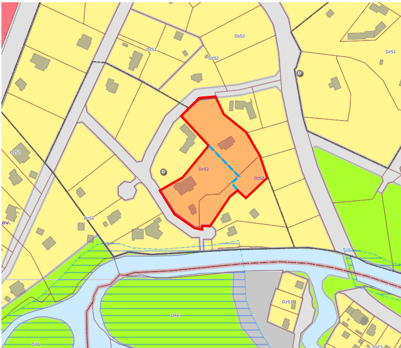
Attēls 2 – Zemesgabala TIAN