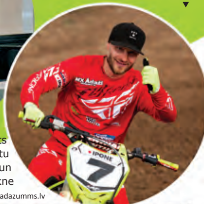
Kandavā motokrosa seriāla "Bosch Superkauss" otrajā posmā komandu ieskaitē, tikai par vienu punktu apsteidzot Rodeo MX RT, uzvaru izcīnīja MX Ādaži.