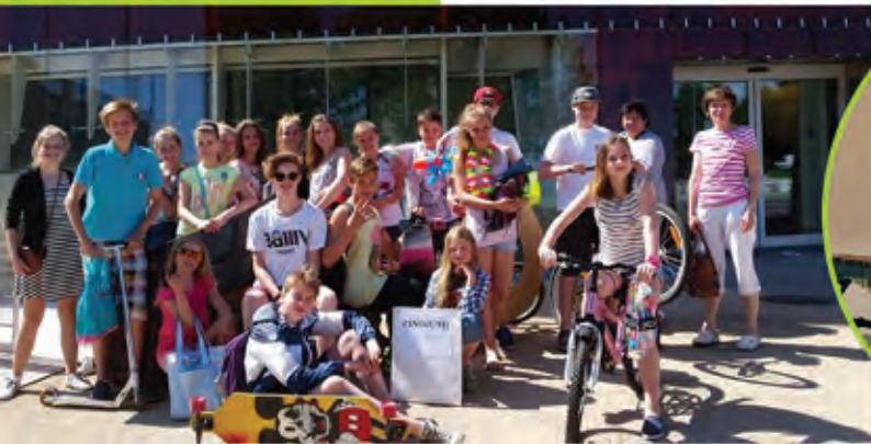
▲ Latvijas skolu teātru festivāls un labāko kolektīvu parāde "Spēlēsīm Te-Ātri" no 2.-4. jūnijam Liepājā.