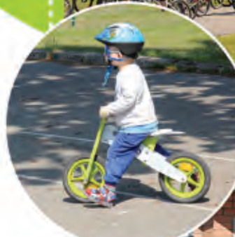
◀◀ Lieli un mazi censoņi "Ādaži-Velo" organizētajās veloorientēšanās sacensībās "Uz zvaigznēm Ādažos III: Dārgumu meklētāji"