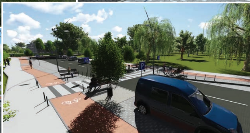
Gaujas ielas vizuālais veidols pēc rekonstrukcijas.

Ādažu novada centrālās ielas daļa, kas veido novada centra seju, Gaujas iela A, vēsturiski atradusies valsts īpašumā. Lai novada ielas centrālā daļa beidzot piedzīvotu atjaunošanu, tā bija jāpārņem pašvaldības īpašumā. Tikai 2014. gada rudenī ar Ministru kabineta rīkojumu Nr.405 "Par valstij piekrietošā nekustamā īpašuma "Gaujas iela A" Ādažos, Ādažu novadā, nodošanu Ādažu novada pašvaldības īpašumā" Satiksmes ministrija bez atlīdzības nodeva šo valsts nekustamo īpašumu pašvaldībai. 2015. gada pavasarī Ādažos norisinājās arhitektu plenērs, kurā profesionāli arhitekti plāvoja Gaujas ielas un jaunā Ādažu centra attīstību. Arhitekti atzinīgi vērtēja, ka plenēri notiek pirms ielas projektēšanas uzsākšanas, citādi nereti