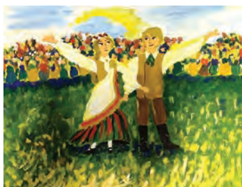
Zīmējuma autore – Dita Bērziņa

Latvijas skolu jaunatnes dziesmu un deju svētki ir lielākie Latvijas bērnu un jauniešu kultūras un mākslas svētki, kuri notiek reizi piecos gados. Bērni un jaunieši ir tie, kas apliecina, ka senās latviešu dziedāšanas, dejošanas un muzicēšanas tradīcijas tiek turpinātas un godā turētas.