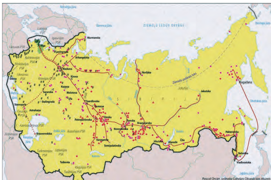
Vietas PSRS, uz kurām tika aizsūtīti Latvijas iedzīvotāji no 1940. līdz 1950. gadam

vietes no Noriļskas un Tālajiem Ziemeļiem – kriminālnoziedzniecēs. Tas bija pavisam cits kontingents – zagles un slepkavas. Bet manām bailēm no šī kontingenta nebija nekāda iemesla, jo sievietes bija ļoti disciplinētas savās attiecībās. Viņām bija viena