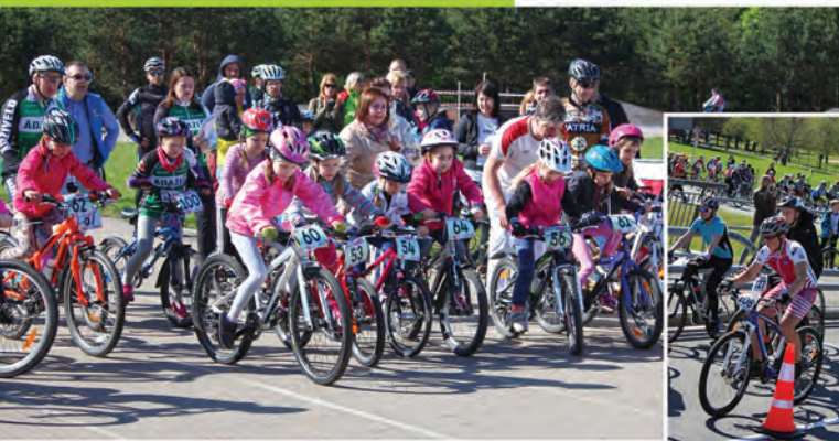
◀ ▼ Ādažu MTB velomaratona drosmīgi startē kā lieli, tā mazi!