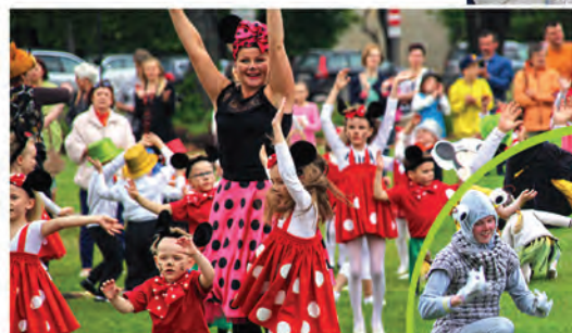
▲ ► Ādažos spilgti aizvadīta Starptautiskā Bērnu aizsardzības diena!

▲ Prāta un sporta spēles, radošums un sadarbība "Zelta zivtiņas" čempionātā Ādažu vidusskolā.