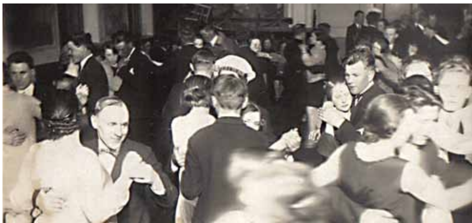
Ādažnieki draiski laižas dejā Tautas nama sarīkojumu zālē. Foto ap 1928. gadu.

vēl gados jaunais, bet vēlāk viens no slavenākajiem latviešu profesionālajiem arhitektiem – Konstantīns Pēkšēns.