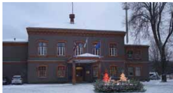
Vecā domes ēka 2009. gada ziemā.