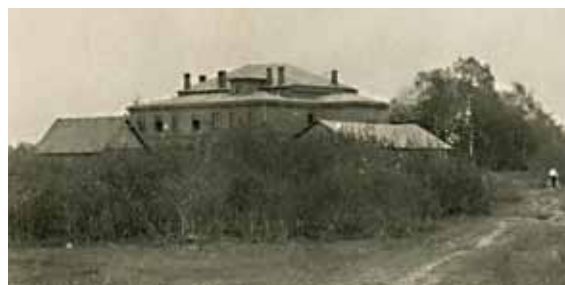
Ādažu pagasta nams 20. gadsimta 20. gados.