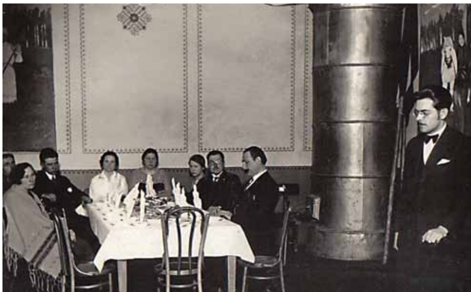
Laikmeta liecības Tautas nama sarīkojumu zālē – bleķa krāsns un sienu gleznojumi nacionālā romantisma stilā. Svētku pasākums, foto ap 1928. gadu.