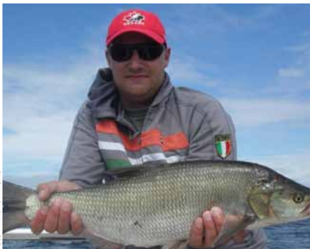
Vareni. Lielais loms. Izdevies noķert meža vimbu (Aspius aspius) jeb salati.