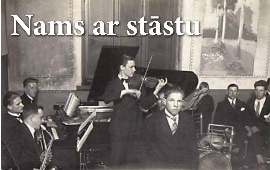
Svētku koncerts Tautas nama sarīkojumu zālē. Foto ap 1928. gadu.