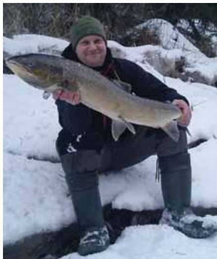
Brangais lasis. Pagājušā gada februārī Salacas upē izdevies noķert lasi.