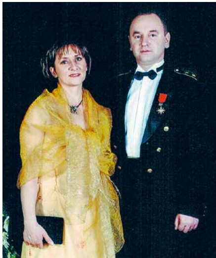
Ar kundzi Ilonu virsnieku ballē Latviešu biedrības namā 2007. gadā.

Viņam nav valstiskās piederības, tie ir nemiernieki. Tās ir organizācijas, kas neatrodas nevienas valsts kontrolē. Viņiem ir savi ideāli, pārliecība, vadītāji. Viņi nēsā civilo apģērbu. Tieši tādēļ karavīra darbs šodien ir ļoti grūts un atbildīgs. Ja nav izteiktas frontes līnijas, kaujas lauks ir visur, un tajā atrodas visi – gan karavīrs, gan seržants, gan ģenerālis. NATO štābs Kabulā piedzīvoja vairākus uzbrukumus, kas ilga pāris dienu. Tas ir štābs, kurā sēž augstākie un vecākie virsnieki. Tas ir viņu kaujas lauks. Mūsdienu karu īpatnība ir tā, ka pretinieks ir nenoteikts, tas varbūt jebkurš. Mūsu karavīriem jāiemācās karot šādā vidē un apstākļos. Tieši tādēļ nav brīnums, ka civiliedzīvotāji iet bojā. Ja bombardē ar lidmašīnām vai artilēriju, pretiniekam ir ļoti vienkārši pienākt pie nogalinātā biedra, paņemt viņa ieročus un pateikt, ka pretinieks nogalinājis civiliedzīvotāju. Šāda izteikta frontes neesamība parādījās pēc terorakta ASV Pasaules Tirdzniecības centra torņiem 2001. gada 11. septembrī un pēc ASV iebrukuma Afganistānā un Irākā. Varbūt lielai daļai cilvēku liekas, ka būt par karavīru – kas var būt vienkāršāks par to – uzvelc formas tērpu, paņem šauteni un uz priekšu! Tā nav. Virsnieks, karavīrs – tā ir