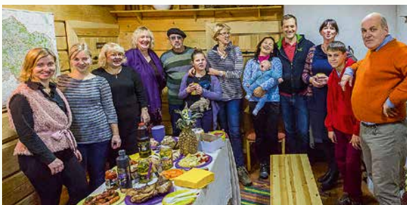
▲ Ādažu Fotogrāfu biedrība atzīmē savu trīs gadu pastāvēšanas jubileju Carnikavas novadpētniecības muzejā.

► Grāmatas „Fotogrāfs Ādažos” autori oktobra sākumā savu darbu dāvināja dažiem tā varoņiem – veselības ministrei Ingridai Circenei, Guntim Ulmanim un Valdim Zatleram. Tā kā Aizsardzības ministrija atbalstīja grāmatas izdošanu, tā tika dāvināta arī aizsardzības ministram Artim Pabrikam.