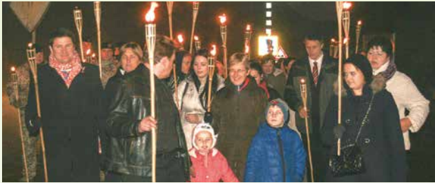
▲ Ādažu novada domes vadība ar Ādažu skolēniem un pedagogiem dodas lāpu gājienā par godu Lāčplēša dienai.

► NATO virspavēlniecība un Baltijas valstu prezidenti Ādažu Kultūras centrā, kur notika NATO militāro mācību "Steadfast Jazz 2013" starptautiska preses konference ar Baltijas valstu prezidentu un NATO ģenerālsēkretāra Andersa Fogu Rasmusena piedalīšanos.