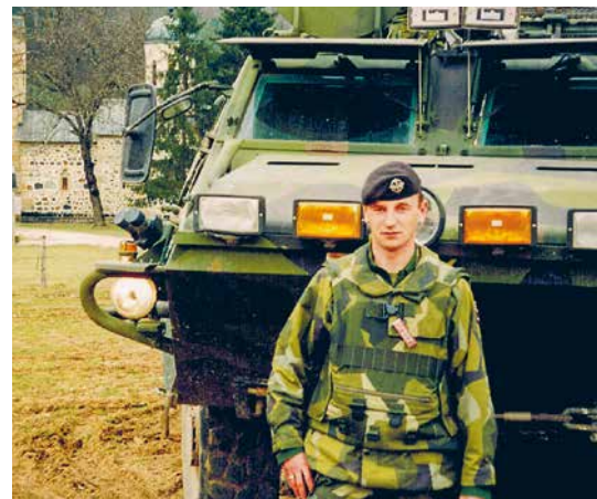
Miera uzturēšanas misija Bosnijā Hercogovīnā 1997. gadā.

Grūti teikt. Katrā ziņā – arī karavīrs ir cilvēks ar emocijām.