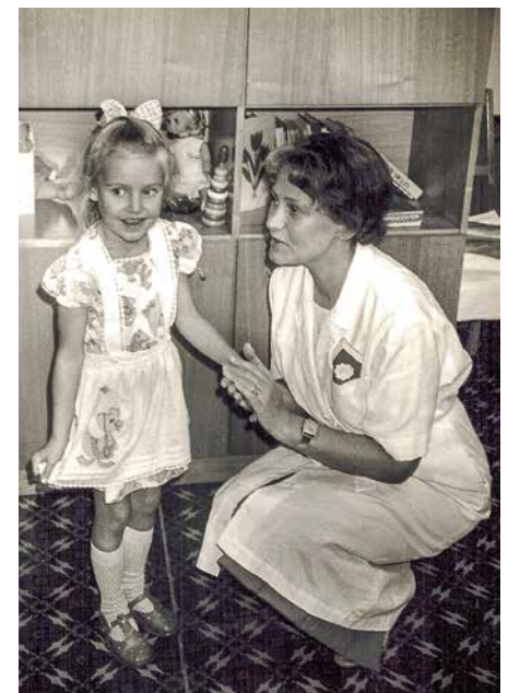
Kolhoza bērņudārzā “Strautiņš” 1987. gada rudenī.

Ja esmu varējusi palīdzēt bērņam, kurš skolā tiek emocionāli pazemots, saskaras ar vardarbību. Lielākais gandarījums ir, ja bērņs uz skolu nāk bez bailēm. Ja ienāk un pasaka: “Man ir daudz labāk, man vairs nedara pāri.” Protams, domājot par ārsta darbu kopumā, vislielāko gandarījumu sniedza spēja kādu izglābt, palīdzēt. Tādu gadījumu manā praksē bijuši daudz. Ir kāds cilvēks, tagad jau nobriedis vīrietis,