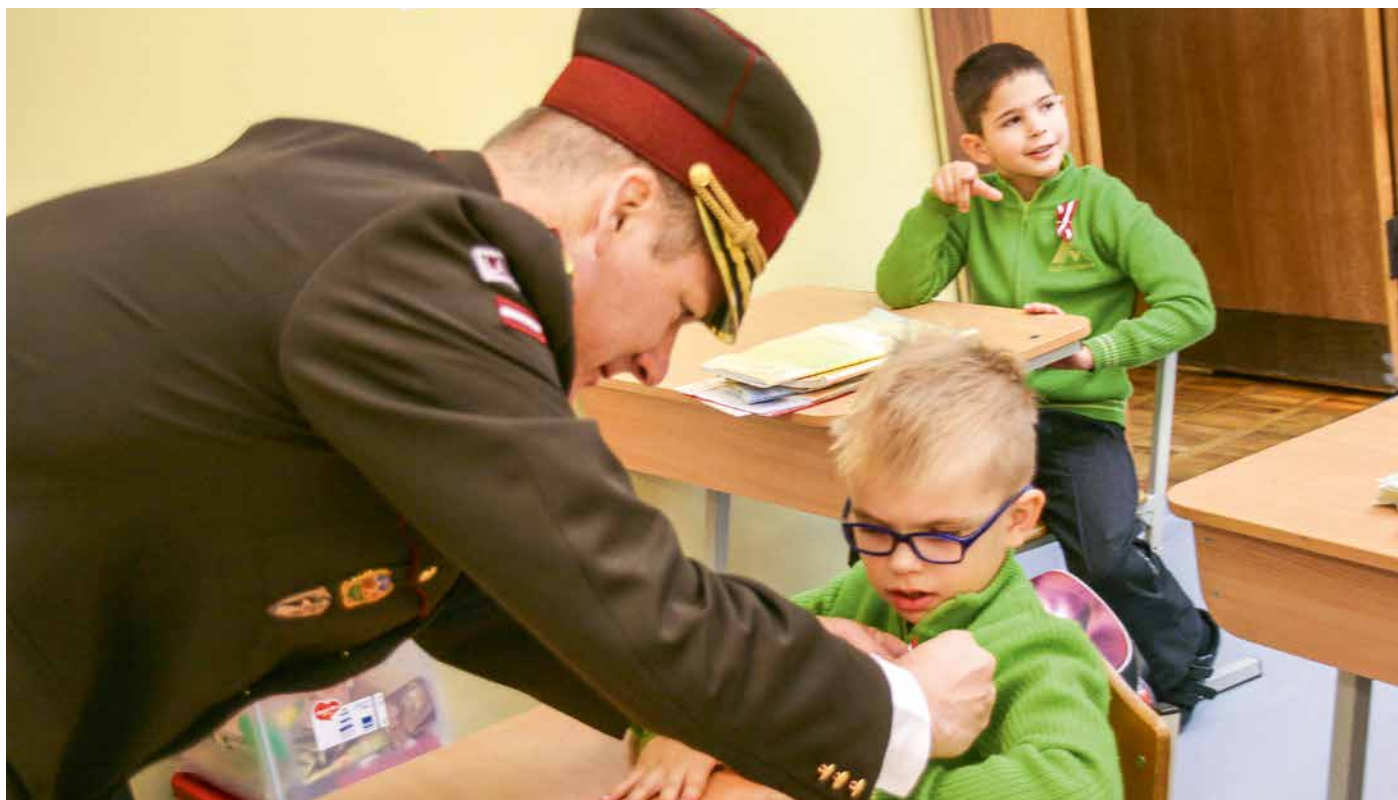
Nacionālo bruņoto spēku pulkvedis Mārtiņš Liberts dāvā skolas atbalsta biedrības sarūpētās sarkanbaltsarkanās lentītes Ādažu vidusskolas skolēniem.

Ar svētku pasākumiem visas nedēļas garumā ādažnieki godina Latvijas valsti