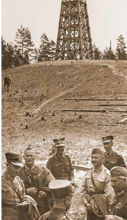
Latvijas armijas Vidzemes artilērijas pulka virsnieki manevru laikā Lilastē. 1937. gads.

bija svēts – savulaik ar sviedriem un asarām izpirkts no muižas. Ādažu zemniekiem no “Abzaļu”, “Zābaku”, “Lilavu”, “Lipstu”, “Niksdēlu”, “Boķu”, “Zaldavu”, “Kauliņu”, “Veckauliņu”, “Siguļu”, “Silzemnieku”, “Kaķu” mājām tomēr bija jāšķiras no saviem – savulaik tik skanīgu vietvārdu apzīmētajiem zemes gabaliem – “Baļķu mežs”, “Dzērves purvs”, “Rampas purvs”, “Puska”, “Uika”. Turpmāk tie būs 12 907,40 hektāru lielās poligona teritorijas sastāvdaļa.