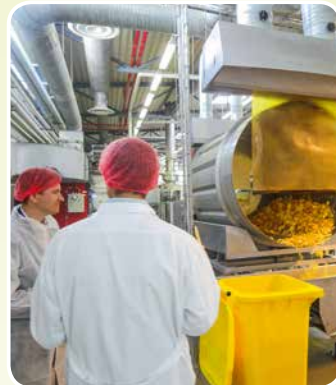
Ādažu novada domes vadība iepazīstas ar ražošanas procesu akciju sabiedrībā „Latfood”.

Kadagas pirmsskolas izglītības iestāde tikusi pie jauniem pasaku varoņu tērpiem.