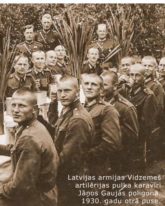
Latvijas armijas Vidzemes artilērijas pulka karavīri Jānos Gaujās poligonā. 1930. gadu otrā puse.

1928. gada oktobrī poligona teritorija oficiāli tika nostiprināta zemesgrāmatā. Valsts godīgi izturējās pret zem-