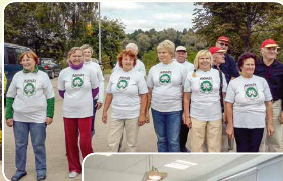
Ādažu seniори gatavi startam Ādažu novada 10. senioru sporta spēlēs.