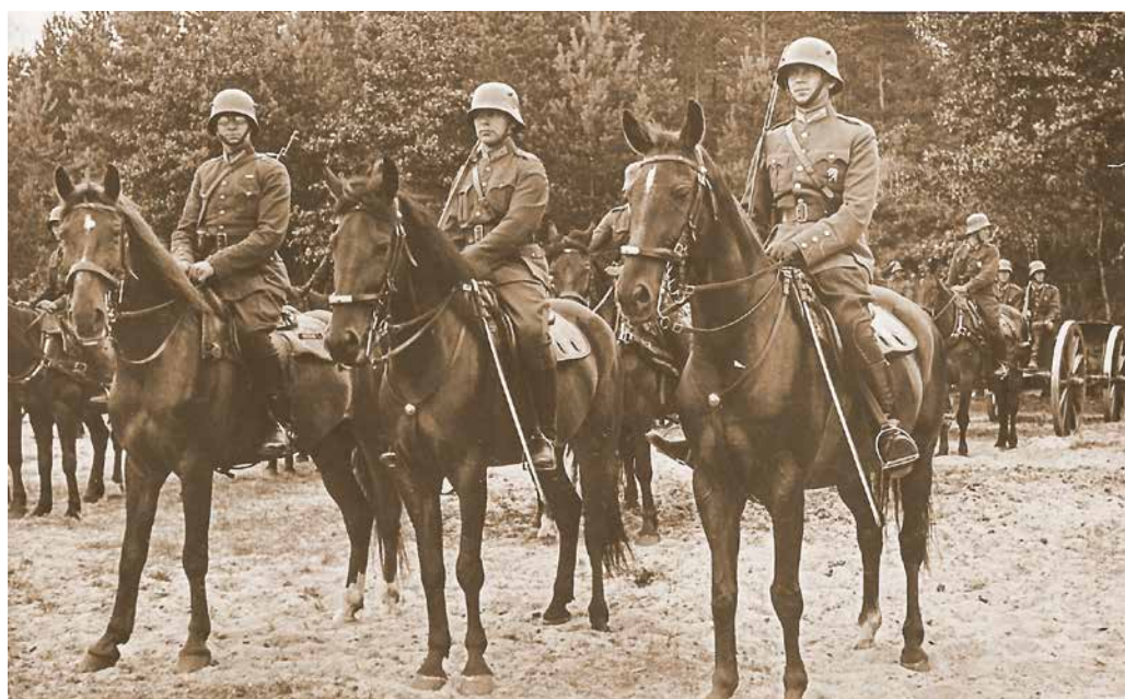
Latvijas armijas Vidzemes artilērijas pulka 3. Rūjienas baterija parādē pulka svētkos poligona nometnē Lilastē. 1937. g. 19. jūlijs.

No 20. gadsimta 40. gadu vidus līdz 1953. gadam poligonu izmantoja