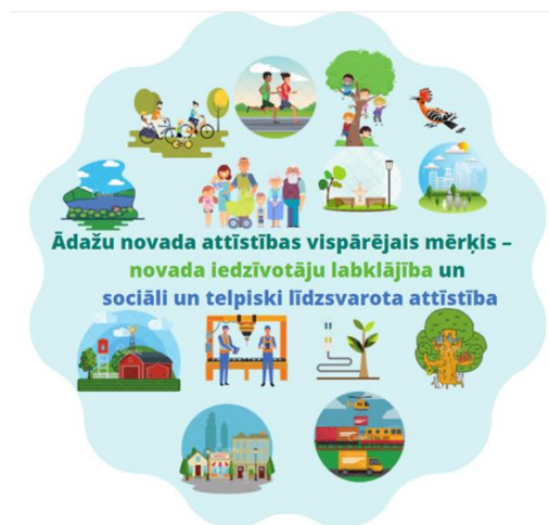
Attēls 3 Novada vispārīgais mērķis

Ādažu novada attīstības vispārējais mērķis – novada iedzīvotāju labklājība – veselīga, labvēlīga un droša vide dzīvošanai, izglītībai, atpūtai un sevis apliecināšanai, kā arī sociāli un telpiski līdzsvarota attīstība , kas virzīta uz daudzveidīgu, uz kultūru un zināšanām balstītu konkurētspējīgu saimniecisko darbību.