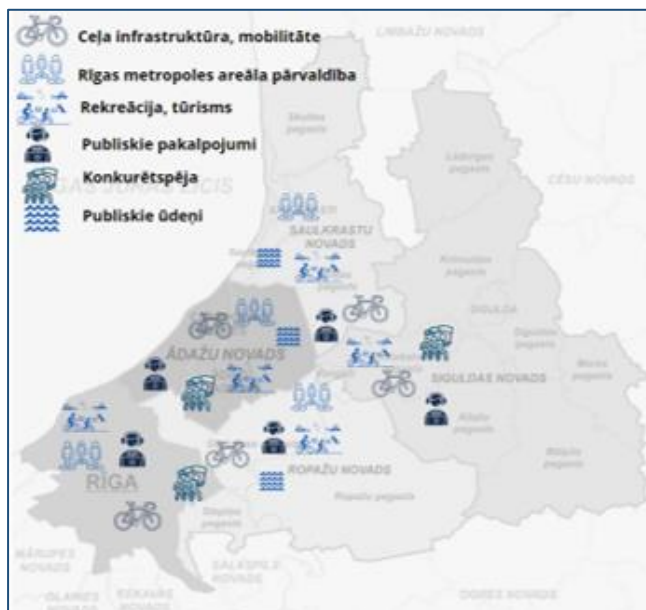
Attēls 9 Kopīgās intereses ar kaimiņu pašvaldībām