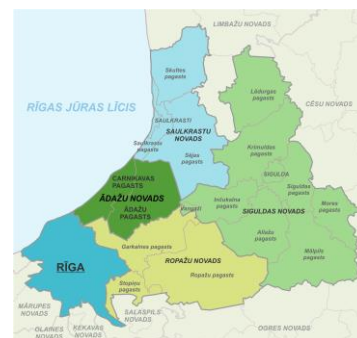
Attēls 2 Ādažu novads

Novada nozīmīgākie objekti: dabas liegumi “Lielā Baltezera salas” un “Lieluikas un Mazuikas ezeri”, dabas parks “Piejūra”, Rīgas ūdensapgādes muzejs, Baltezera (Ādažu) luterāņu baznīca, Komunistiskā masu terora upuru piemiņas vieta un kapi, Carnikavas kapi ar O.Vācieša atdusas vietu, kājāmģājēju tilts pār Gauju, Carnikavas Novadpētniecības centrs, Ādažu Kultūras centrs, Carnikavas muižas apbūve.