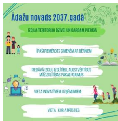
Attēls 4 Ādažu novads 2037.gadā

2037.gadā Ādažu novads būs izcila teritorija dzīvei un darbam Pierīgā . Teritorija, kas īpaši piemērota ģimenēm ar bērniem, inovatīviem ražošanas uzņēmumiem, aktīvās atpūtas cienītājiem; teritorija, kurā bērni un jaunieši varēs iegūt izcilu izglītību un pieaugušajiem būs pieejami augstvērtīgi mūžizglītības pakalpojumi .