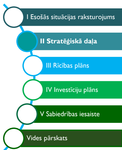
Attēls 1 Attīstības programmas sastāvdaļas