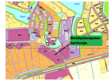
Teritorijas novietojuma shēma